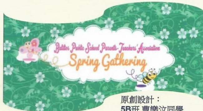
原創設計： 5B班 曹樂汶同學

首先感謝家長教師會給予我寶貴的機會為今年度春節聯歡會設計橫額，讓我能於繪畫以外接觸新的範疇。