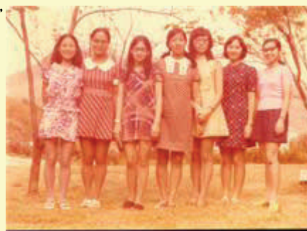
一張泛黃的照片，見證了我的「迷你裙」時代。這是音樂系的女同學，左數第三人亦已離世，倍覺唏噓。

崇基歲月是我一生中最美好的日子。一年級時主修音樂，二年級轉唸英文系，副修中國文學，那是我覺得世界上最幸福的事。大學四年，我有機會接觸從小便醉心的文學，讀了許多優美的英詩、戲劇和小說，加強我對文字的敏感度和欣賞能力，讓我日後受用無窮。在這四年中，我結識了不少良朋知己，到今天我們仍是無所不談的好朋友。更重要的是，崇基讓我在一個山明水秀的環境中靜靜地長大。我們一夥吃過晚飯便在吐露港泛舟，又或者沿著海邊散步，在人跡罕至的「海洋生物研究所」旁邊談音樂、說理想。夕陽的餘暉映照在年青的臉上，我們都那麼熱愛生命、對於未來，每個人聲有一種磨拳擦掌的熱切期待，深信必有一個奇蹟會在我們身上降臨。