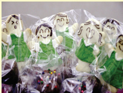
校服公仔曲奇義賣